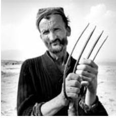
新疆维吾尔自治区古代维吾尔人定居点 克普林的农民